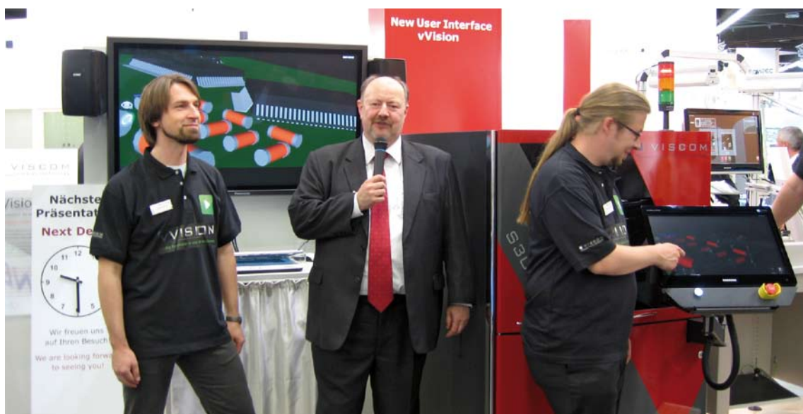
Vorstellung der neuen Benutzeroberfläche „vVision“ auf der Messe „SMT Hybrid Packaging 2010“

Erstmals wurde diese neue anwenderfreundliche Benutzeroberfläche auf der Messe „SMT Hybrid Packaging 2010“ am 8. Juni 2010 in Nürnberg vorgestellt und stieß auf eine breite positive Kundenresonanz.